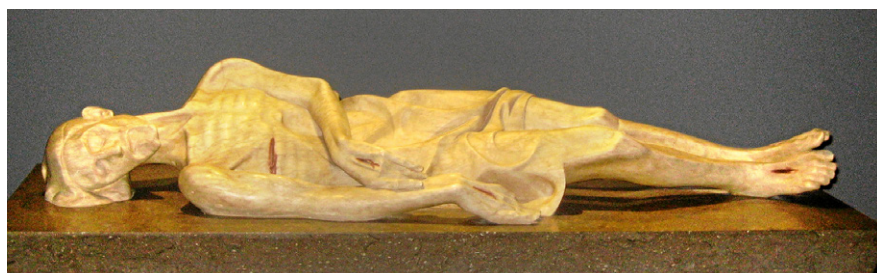
El Crist jacent, obra de Domènec Fita

En la vetllada inaugural d'aquesta exposició va pronunciar una conferència sobre «L'art contemporani en la litúrgia després del Concili Vaticà II» el P. Abat de Montserrat, el gironí Josep Maria Soler. En la seva intervenció va assenyalar que l'Església no ha tingut cap estil artístic propi i que ha admès tots els corrents creatius, i que això ha generat un tresor artístic que cal conservar. En aquest context va situar l'art integrat religiós de Fita, que «compleix el requisit fonamental de ser la representació visible d'una realitat invisible». També trobarem exposicions en el marc de l'Any Fita a la Fundació de l'artista (Casa de Cultura), fins al 13 de gener; a la Fundació Valvi, fins al 5 de gener; al Palau de Congressos, fins al 28 de gener, i al Centre Cultural la Mercè, fins al 13 de gener.