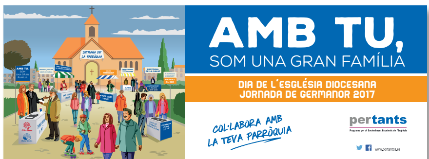
Cartell Germanor 2017

Estem molt acostumats a la presència i a l'acció de l'Església, de les parròquies, en els nostres pobles, viles i