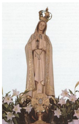
Imatge de la Mare de Déu de Fátima al Pertús (La Jonquera)