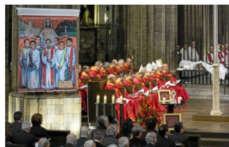
Imatge de la celebració de beatificació

El dia 6 de maig, la Catedral de Girona va acollir la beatificació de set missioners del Sagrat Cor, assassinats l'any 1936. El cardenal Angelo Amato va dir que una celebració com aquesta és una bona ocasió per tenir en compte que «la societat humana no té necessitat d'odi, sinó d'amor». En aquesta línia, el bisbe Francesc Pardo va afirmar que «una beatificació no és una reivindicació ni una reclamació de justícia, sinó sobretot una acció de gràcies de tota l'Església per la vida i l'exemple d'aquests testimonis de fe i de vida cristiana».