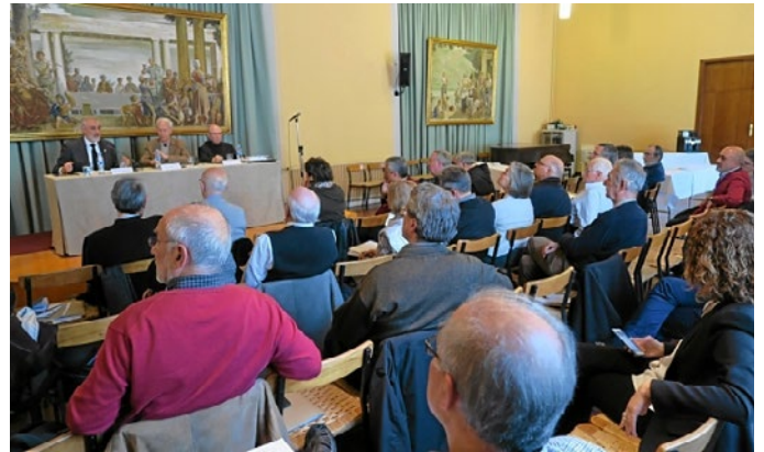
El mes de març va tenir lloc a Montserrat el II Congrés Qüestions de Vida Cristiana, amb participació de professionals i pensadors catòlics de diverses diòcesis catalanes

«Són pocs els pensadors que en els mitjans donin raó de la fe, reflexionant sobre temes oberts i controvertits»