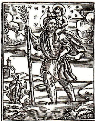
Sant Cristòfol, patró dels automobilistes. Imatge dels goigs de Sant Cristòfol, de la parròquia de Sant Cristòfol les Fonts

En general, avui dia s'ha perdut força el respecte. En tinc experiència en la meua tasca. Hi ha gent que puja a l'autobús sense saludar, sense dir ni bon dia ni bona tarda, sense miraments, cridant, posant la música alta, parlant per telèfon a crits...; o que, com els adolescents, posa els peus sobre els seients o s'aixeca del seient, amb el