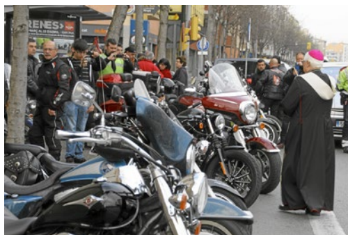
Benedicció de motos. Pelegrinatge a Montserrat 2015, organitzat per la Delegació de Pastoral del Trànsit

La prudència és important a l'hora de compartir les vies públiques, les que són de tots. Aprofitem els desplaçaments per gaudir del contacte amb la natura, amb la creació de Déu i dels homes. Fem que les nostres actituds mai siguin perilloses per als germans amb qui ens creuem per les carreteres. Donem testimoni de la nostra fe també al conduir. El papa Francesc deia en la Setmana Mundial de les Nacions Unides: «Tota vida és sagrada. Hem de fer de les carreteres un lloc segur. Redueix la velocitat per salvar vides».