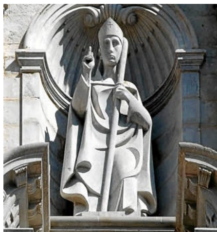
Sant Narcís, de Domènec Fita. Catedral de Girona

Presentació dels actes de l'Any Fita. A les 12 del migdia a la casa de Cultura de Girona. El bisbe Francesc hi serà present.