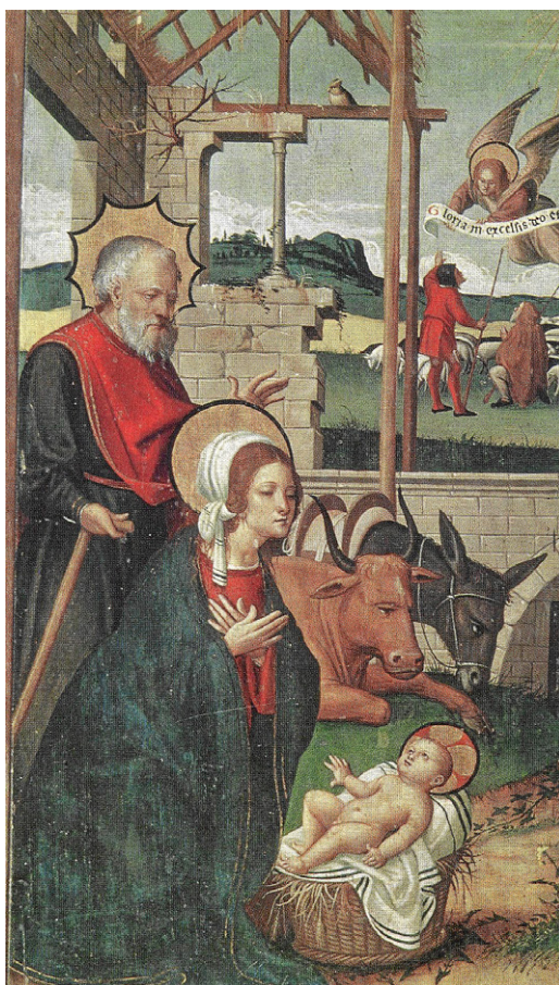
Fragment del retaule Nativitat, de Pere Mates (s. XVI). Museu d'Art de Girona

Nadal fa possible contemplar el món, la història, la vida... des d'una renovada comprensió: el Fill de Déu ha assumit la nostra carn, la nostra història, la nostra vida, per renovar-la i alliberar-la del mal i de la mort, per salvar-la.